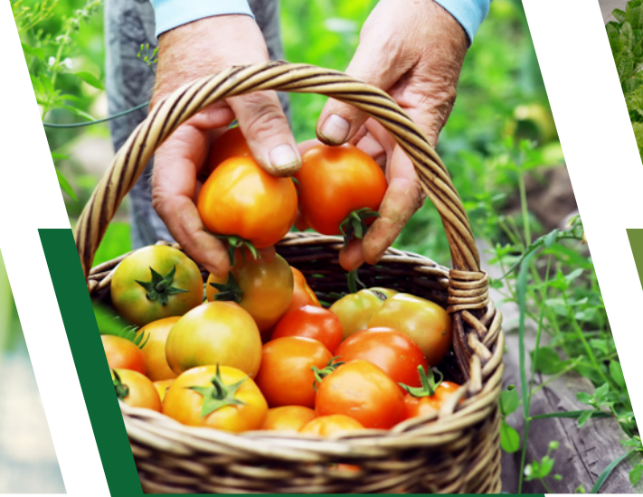
أفضل مزارع بحرينية