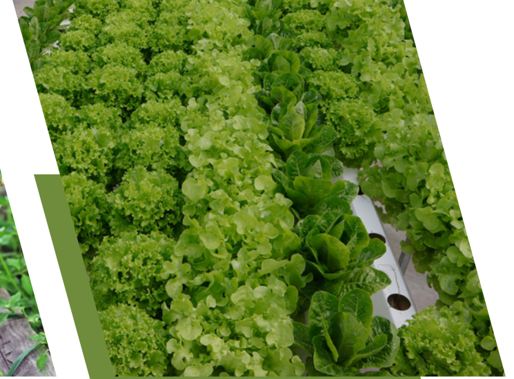
أفضل مشروع زراعي