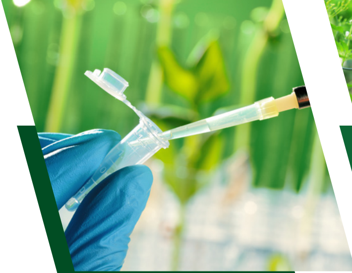
أفضل الدراسات والبحوث الزراعية

تُقسَم جائزة الملك حمد للتنمية الزراعية إلى ثلاثة محاور: